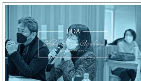
FDAホームページのTOPページ

FDA専用ホームページでは、過去に受講された方のインタビュー動画を紹介しています。